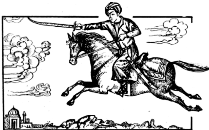
Рис. 4. Клыч – Батыр

Но узбекские сказки – это не только фантастические повести, но и рассказы о животных, и сатирические истории. В них рассказывается о том, как трудолюбивые звери своим упорством и сплоченностью справляются с кровожадными хищниками, защищая слабых и обездоленных.