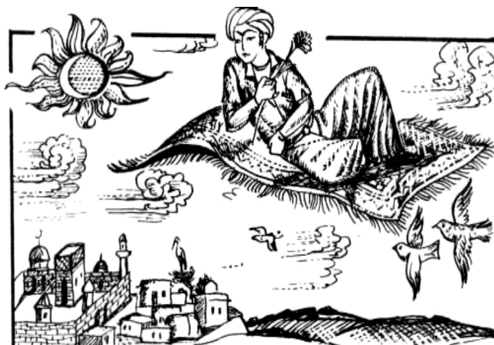
Рис. 1. Волшебный коверик

По содержанию, художественным образам и особенностям композиции узбекские народные сказки можно разделить на три большие группы — сказки о животных, волшебно-фантастические и бытовые. Узбекские народные сказки в фантастической форме повествуют о героизме и преданности, любви и жизни людей, они направлены на воспитание подрастающего поколения. Они рассказывают о деяниях могущественных джиннов, властителях мира джахангиры, прекрасных девушках пери и храбрых богатырях, которые готовы рискнуть жизнью для спасения прекрасной даме. Достичь цели главному герою помогают волшебные предметы: ковер-самолет, волшебное кольцо или нож, а также самобьющая дубинка.