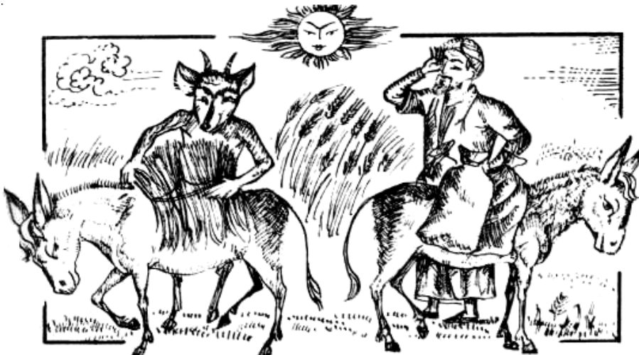
Рис. 5. Шайтан

В то время как сатирические рассказы высмеивают людскую праздность, леность, восхваляя ремесло и знания людей.