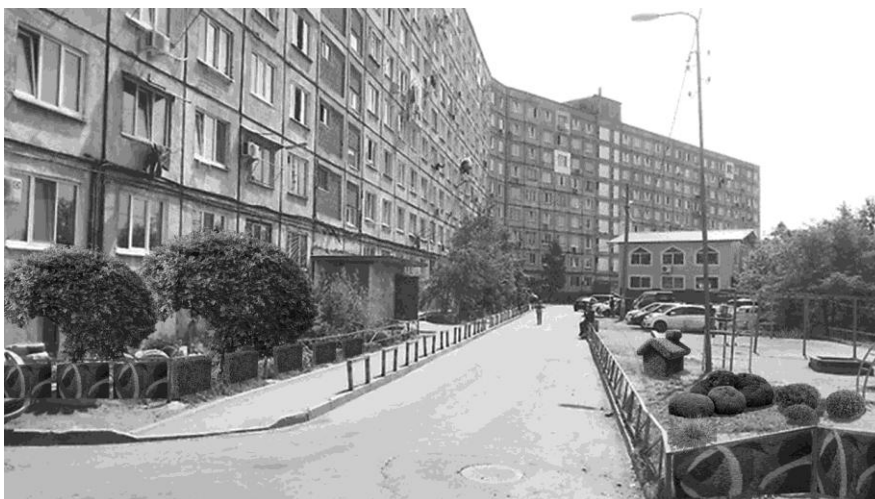
Рис. 6. Концептуальное проектное предложение придомовой территории