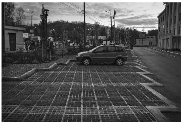
Рис. 2. Эко-парковка

Широкое использование эко-парковок на придомовых территориях не только улучшает экологию, но эстетически облагораживают среду (рис. 2). Технология строительства эко-парковок позволяет дать парковочные места и травяные площадки. Для эко-парковки легковых автомобилей, на 200 т на м 2 , используют решетки с ячейками в форме ромба. Решетка кладется на готовое основание, заполняется грунтом и засеивается газонной травой. Эко-парковки дают кислород и регулируют влажность воздуха [3].