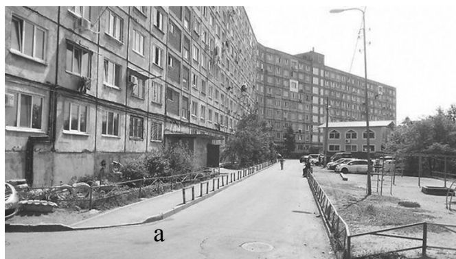
Рис. 5. Исходная ситуация

Можно предложить проектное предложение с использованием плетущегося девичьего винограда, который обвивает ограждения площадок, смягчают композицию стриженные, округлой формой, кусты форзиции и вишни, которые цветут в весенний период, и создают приятную атмосферу для отдыха (рис. 6).