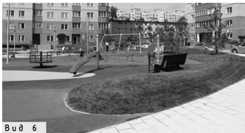
Рис. 3. Геопластика

Геопластика помогает эффективно укреплять грунт. Благодаря применению различных решений, недостатки рельефа превратить в очень красивые участки ландшафта (рис. 3). При помощи геопластики можно изменить общую перспективу ландшафта придомовой территории, создать иллюзию большего пространства, использовать небольшие площадки на искусственных холмах или многоуровневую террасу, с которой можно осматривать всю территорию. Также для геопластики используют элементы водного ландшафта, искусственные и натуральные камни, густые травы и кусты [4].