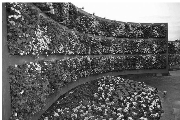
Рис. 1. Вертикальное озеленение

вертикальное озеленение (рис. 1), можно использовать для балконов, в оформлении ограждений, подпорных стенках, как зонирование на детских площадках [2].