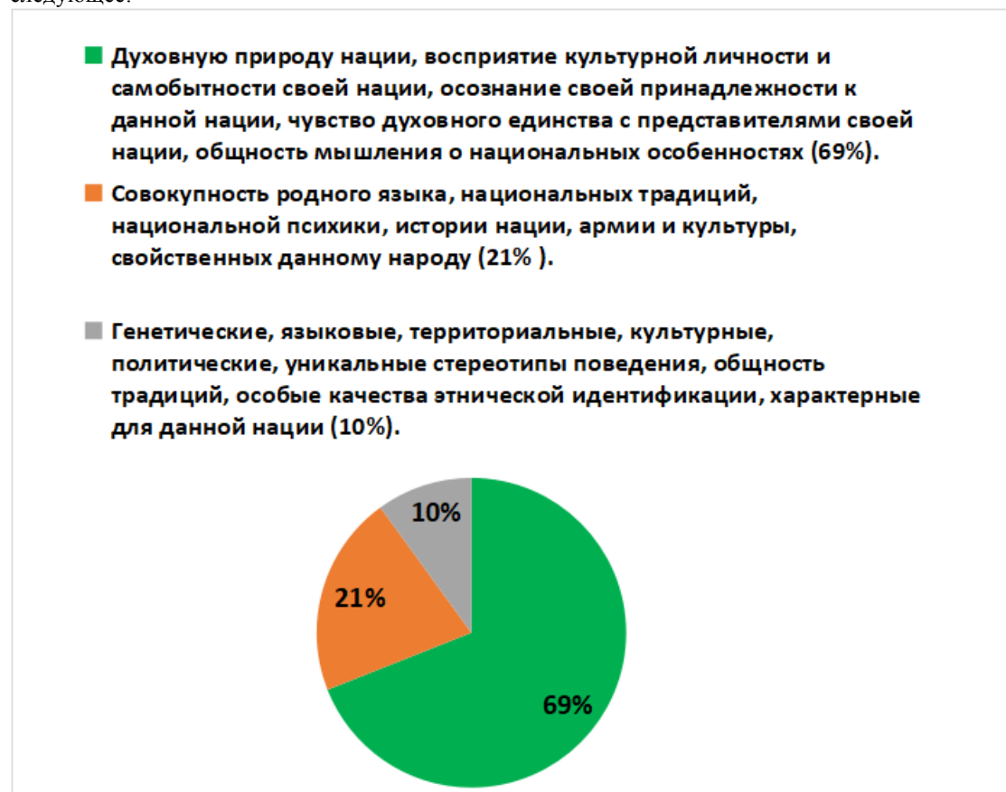
Диаграмма 1. Как бы вы объяснили понятие «Национальная идентичность»?

Под национальной идентичностью большинство опрошенных (69%) понимают следующее: